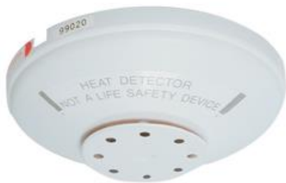
Figura 1: Detector de calor mecánico serie 281B-PL