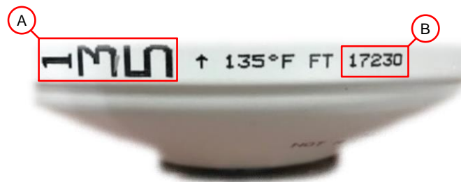
Figura 4: Identificación del producto afectado

Paso 3 (si corresponde): Tome una foto del ático residencial o la instalación de un garaje residencial