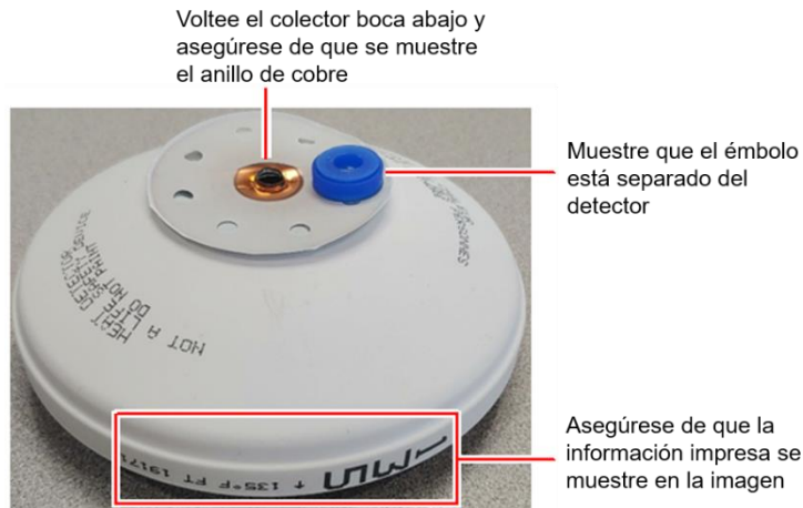
Figura 6: Evidencia de destrucción.